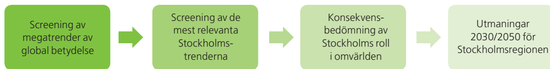
Figur 2. Rapportens analys har genomförts i fyra skilda block.

kring en framtidsbild utifrån ett antal utvecklingskurvor. Bilden de förmedlar stämmer troligen mer eller mindre väl med en önskad utveckling för Stockholm. Det innebär att länet måste förhålla sig till de olika trenderna på olika sätt – de behöver alla särskild uppmärksamhet.